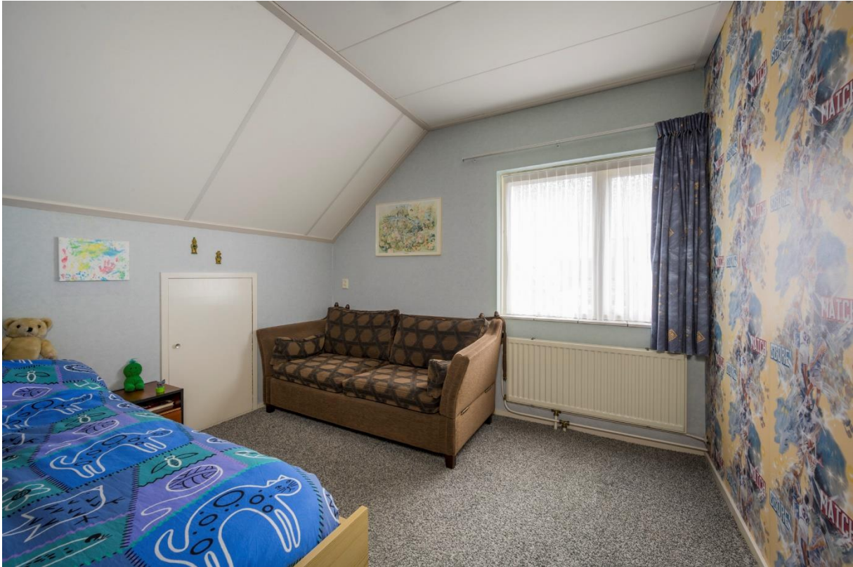
Slaapkamer 3 en 4