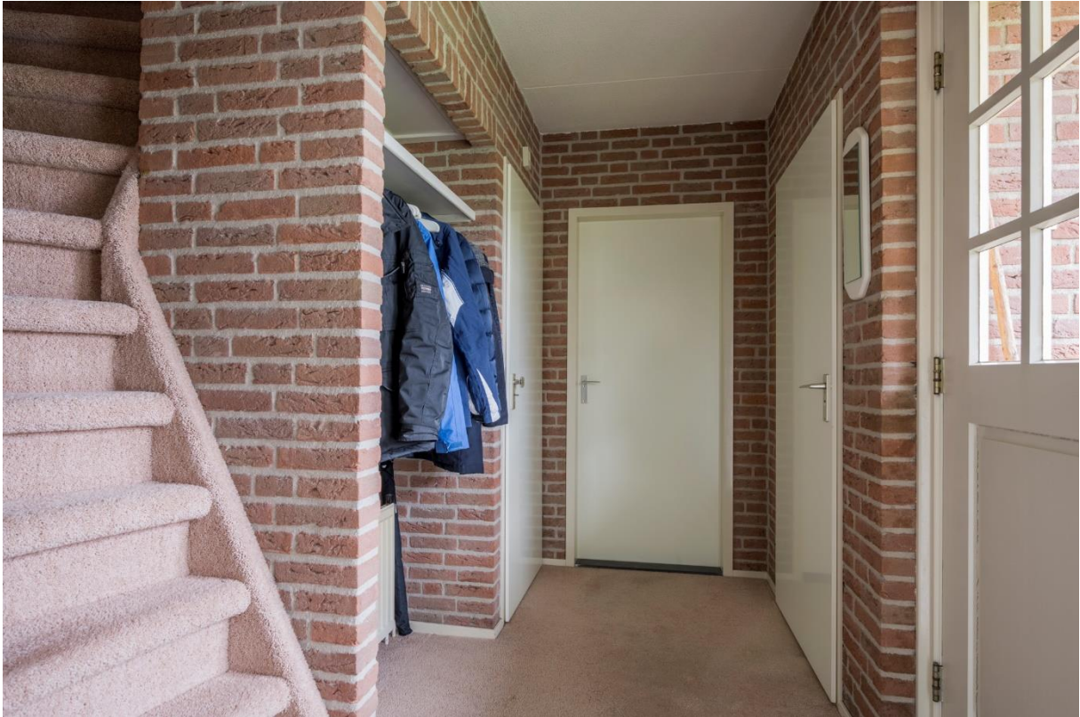
Hal met toegang tot de woonkeuken